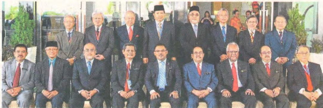
马目阿当（前排左四）与出席第 16 届公共服务委员会大会开幕仪式的贵宾。前排左五为甲首长拿督威拉依德利斯哈仑。