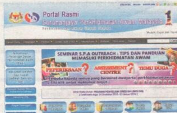
Portal rasmi SPA.

Menurutnya, SPA akan sentiasa memastikan calon-calon dilantik dalam perkhidmatan awam bukan sahaja me-